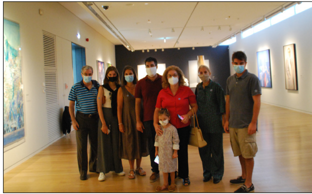
Η μία ομάδα Φουρνιωτών κατά την ξενάγηση

φορέα ανάπτυξης πρωτοποριακών πολιτιστικών δράσεων, αξιοποιώντας σύγχρονες μουσειακές εφαρμογές στον χώρο της νεότερης και σύγχρονης ελληνικής και διεθνούς τέχνης.