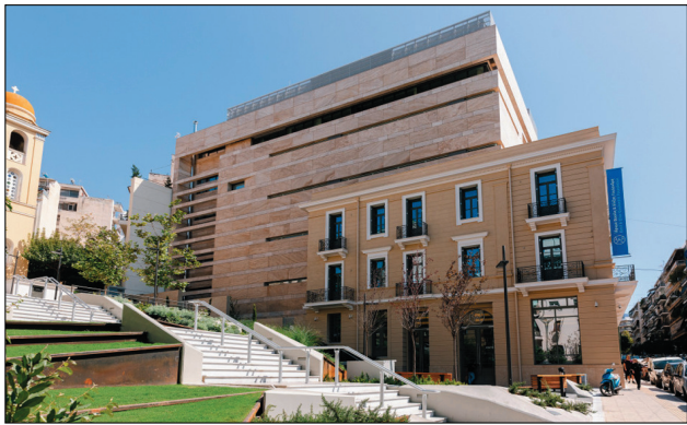
Εξωτερική άποψη του Μουσείου

Η συλλογή του Ιδρύματος Βασίλη και Ελίζας Γουλανδρή είναι από τις σημαντικότερες ιδιωτικές συλλογές που δημιουργήθηκαν κατά το δεύτερο ήμισυ του 20ού αιώνα. Πρωταρχικός σκοπός του νέου μουσείου που ανεγέρθηκε στην Αθήνα είναι να στεγάσει αυτή τη συλλογή και να την κάνει προσβάσιμη στο κοινό, σύμφωνα με την επιθυμία των Ιδρυτών.