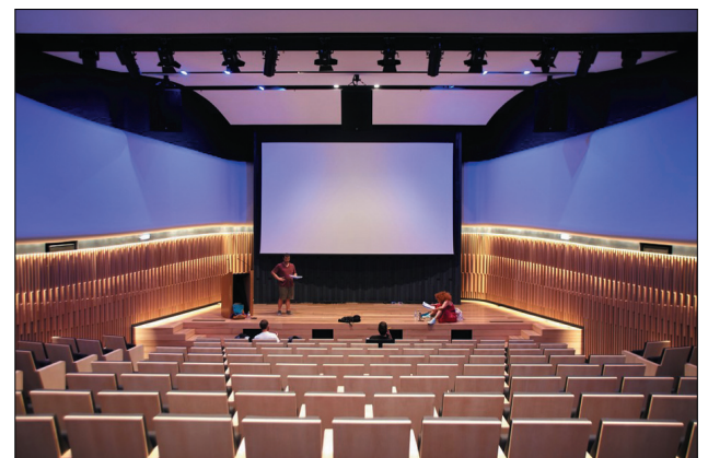
Το Αμφιθέατρο του Μουσείου

Μπαίνοντας στην είσοδο στο ισόγειο του Μουσείου δεσπόζει στο βάθος ένας μεγάλος εντυπωσιακός πίνακας, που απεικονίζει την Ελίζα Γουλανδρή διά χειρός Μαρκ Σαγκάλ, του 1969. Δεν αδίκησε καθόλου την ομορφιά της Αθηναίας ο Γάλλος καλλιτέχνης. Ανάμεσα σε μια πανδασία χρωμάτων, με τα μεγάλα καστανά της μάτια και την κομψή κορμοστασιά, η σικατή και διορατική καλλονή που βρισκόταν δίπλα στο