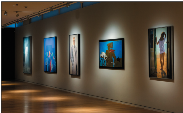
Εσωτερικό του Μουσείου - Έλληνες Ζωγράφοι

Όπως ισχύει για κάθε συλλογή, έτσι και με τη συγκεκριμένη, τα κριτήρια επιλογής των έργων που τη συγκροτούν υπήρξαν καθαρώς υποκειμενικά. Ο Βασίλης και η Ελίζα Γουλανδρή, αν και περιβάλλονταν ήδη από τις αρχές της δεκαετίας του 1950 από διακεκριμένους ιστορικούς και επαγγελματίες της τέχνης, επέλεξαν τα συγκεκριμένα έργα με μοναδικό γνώμονα τις προσωπικές προτιμήσεις τους και τους δικούς τους αισθητικούς κώδικες. Σχεδόν επί πενήντα χρόνια έχτιζαν τη συλλογή τους με φροντίδα, υπομονή και πραγματική αφοσίωση, με απώτερη βλέψη, κάποια μέρα, να εκτεθεί στο μουσείο που είχαν κατά νου.