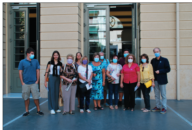
Η παρέα των Φουρνιωτών και Φίλων του Συλλόγου στην είσοδο του Μουσείου

Το κτήριο έχει συνολική επιφάνεια 7.250 τ.μ. και αποτελείται από 11 ορόφους , πέντε εξ' αυτών κάτω από την επιφάνεια του εδάφους. Οι εκθεσιακοί χώροι καταλαμβάνουν