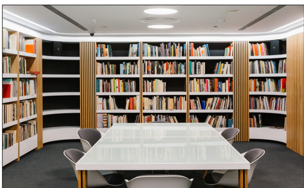
Η Βιβλιοθήκη του Μουσείου

Η ανέγερση του νέου μουσείου του Ιδρύματος Βασίλη και Ελίζας Γουλανδρή ξεκίνησε τον Αύγουστο του 2012 και ολοκληρώθηκε τον Οκτώβριο του 2018, 25 χρόνια μετά τον θάνατο του Βασίλη και 19 χρόνια μετά τον θάνατο της Ελίζας Γουλανδρή, σηματοδοτώντας την αρχή ενός νέου κεφαλαίου για το Ίδρυμα, σκοπός του οποίου είναι, παράλληλα με το μουσείο της Άνδρου, να αναδείξει τη νέα αυτή εστία σε