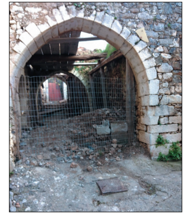
Οι καμάρες υποστύλωνται