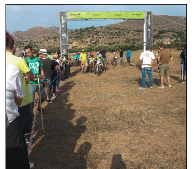
Στιγμιότυπο από τους αγώνες, κατά την εκκίνηση

Την Κυριακή 18 Οκτωβρίου ο Ποδηλατικός Όμιλος Δρήρος Νεάπολης με την συμπαράσταση του Πολιτιστικού Συλλόγου Φουρνης «Η ΕΥΑΓΓΕΛΙΣΤΡΙΑ», διοργάνωσε αγώνα ορεινής ποδηλασίας στη Φουρνή. Με την συμβολή πολλών φορέων έγινε στην πανέμορφη τοποθεσία της Φουρνης η παρθενική διοργάνωση που άφησε μόνο ευχαρίστες αναμνήσεις σε όσους βρέθηκαν είτε σαν αθλητές, είτε σαν συνοδοί και παράγοντες των ομίλων.